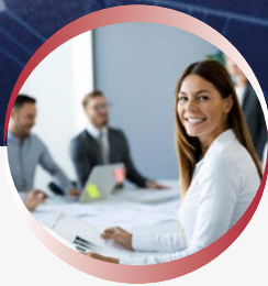
ASSISTANCE À MAÎTRISE D'OUVRAGE